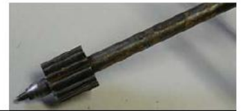
- Óxidos - Venterol - Tuercas - Martillo - Piñones