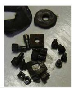
- Frontis y esfera - Caja y campana - Mecanismo - Péndulo - Tornillos