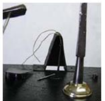
- Eliminación de óxidos, pulido, azulado, lubricado, reposición mecanismo calendario, reparación péndulo, suspensión, etc