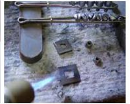
- Desmontaje de todos y cada uno de los elementos que componen el reloj, limpieza, reparaciones, ajustes, etc